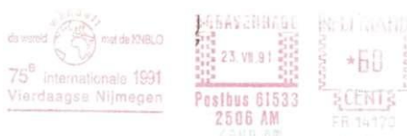
Afbeelding 2: Stempel KNBLO "de wereld wandelt", 's-Gravenhage, 23.VII.1991.

Dit internationale karakter werd in 1991 door de KNBLO uitgewerkt in een frankeermachinestempel met wereldbol en de tekst "De wereld wandelt met de KNBLO".