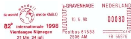
Afbeelding 4 (boven) en 5 (onder): Stempels KNBLO, op 10 juni 1998 nog in 's-Gravenhage, op 18 juni 1999 in Nijmegen. De frankeermachine is dezelfde (FR 55976), met "De wereld wandelt" en wereldbol. 82e resp. 83e Internationale Vierdaagse.

Na 90 jaar in 's-Gravenhage te hebben gezeteld, was 1998 voor de KNBLO het jaar van de grote verhuizing. Besloten werd de bond te verplaatsen van het Valkenbosplein naar de Groesbeekseweg in Nijmegen. Reden hiervoor was dat de bestaande Haagse accommodatie niet meer voldeed en dat er eigenlijk geen overwegingen waren om beslist in Den Haag te blijven. De vestigingskeuze viel op Nijmegen, waar de bond al vanaf 1925 jaarlijks de Vierdaagse organiseerde. Vanaf 1 januari 2010 zetelen beide organisaties aan de Berg en Dalseweg.