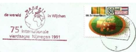
Afbeelding 12: Stempel "De wereld wandelt in Wijchen"; de wandelaars lopen hier de 2e dag doorheen. Bij deze stempeling is alleen de "olag" van het frankerestempel afgedrukt, en de frankering gedaan met de speciale Vierdaagse postzegel uit 1991.

In de afb. 11 (voorblad) t/m 14 zijn enkele voorbeelden van deze stempels te zien, met varianten in lay out en gebruik. In de plaats van "De wereld wandelt met de KNBLO" staat er "De wereld wandelt in .... (plaatsnaam)".