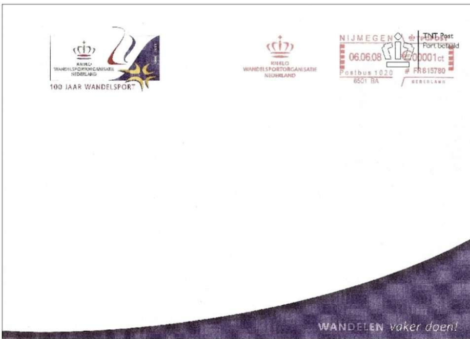
Afbeelding 10: Stempel KNBLO-NL Nijmegen, 06.06.08, op een verzoek-stempel (01 ct) van 6 juni 2008. Naast het "algemene KNBLO-logo" de vermelding van het 100-jarig bestaan.

Het speciale jubileum-stempel van de KNBLO uit 1991 werd, in iets gewijzigde vorm, overgenomen door de gemeente Nijmegen en de zogenaamde "doorkomstgemeenten".