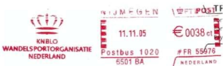
Afbeelding 8: Stempel KNBLO Wandelsportorganisatie Nederland met Koninklijk kroontje, Nijmegen, 11.11.05.

2004 was voor de KNBLO weer een jaar van een grote verandering. In dat jaar fuseerde de KNBLO met de Wandelsportorganisatie Nederland. In 2004 gebruikte de KNBLO, buiten de Vierdaagse-periode om, een frankeremachinstempel met het eigen logo in plaats van het logo van de Vierdaagse.