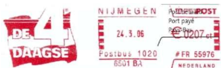
Afbeelding 9: Stempel De 4 Daagse, Nijmegen, 24.3.06.

In 2005 werd wederom een nieuw logo voor de Vierdaagse geïntroduceerd, nu met de nadruk op "4" en een duidelijke Nederlandse vlag als achtergrond. Dit logo was voor het eerst in 2006 te zien en is nog steeds in gebruik.