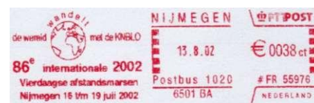
Afbeelding 6: Stempel KNBLO Nijmegen, met "internationale Vierdaagse afstandsmarsen". 86e Vierdaagse, gestempeld op 13 augustus 2002.

In het dagelijks leven hebben we het altijd over de Vierdaagse. De officiële benaming van dit wandelevenement is echter "Internationale Vierdaagse afstandsmarsen". Dit zien we o.a. ook in het stempel van de 86e Vierdaagse uit 2002.