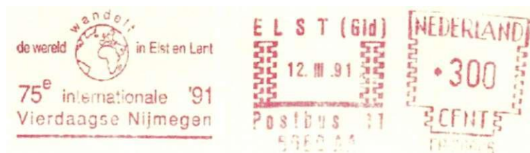
Afbeelding 11: Stempel "De wereld wandelt in Elst en Lent", doorkomst gemeente op de eerste wandeldag.