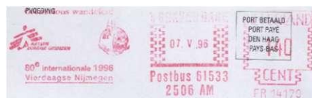
Afbeelding 3: Stempel KNBLO "Grenzeloos wandelen". Artsen zonder grenzen, 's-Gravenhage, 7.V.1996, 80e Vierdaagse.

Uitzondering daarop was het jaar 1996, toen opnieuw een jubileum werd gevierd, nu vanwege de 80e editie van de Vierdaagse. Daarbij werd er speciale aandacht gevraagd voor het werk van de organisatie "Artsen zonder grenzen". Het thema van deze 80e Vierdaagse werd dan ook "Grenzeloos wandelen!". Dit is terug te vinden in het stempel van de KNBLO, en ook nu werd dit initiatief weer door Nijmegen en enkele doorkomstgemeenten overgenomen, zoals we hierna zullen zien.