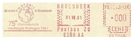
Afbeelding 13: Stempel "De wereld wandelt in Groesbeek", waar de derde en zwaarste dag gelopen wordt.