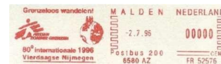
Afbeelding 16: Stempel "Grenzeloos wandelen" Malden (gemeente Heumen), -2.7.96.