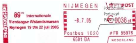
Afbeelding 7: Stempel KNBLO, met het nieuwe logo "de 4 daagse" met een grote vier. 89e Vierdaagse, Nijmegen 8 juli 2005. Enkele kleine variaties: de woorden Internationale en Afstandsmarsen zijn met een hoofdletter geschreven, en 86e is veranderd in 89ste.

2004 was voor de KNBLO weer een jaar van een grote verandering. In dat jaar fuseerde de KNBLO met de Wandelsportorganisatie Nederland. In 2004 gebruikte de KNBLO, buiten de Vierdaagse-periode om, een frankeremachinstempel met het eigen logo in plaats van het logo van de Vierdaagse.