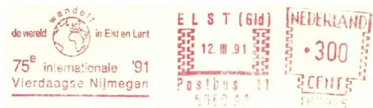
Afbeelding 11: Stempel "De wereld wandelt in Elst en Lent", doorkomst gemeente op de eerste wandeldag.