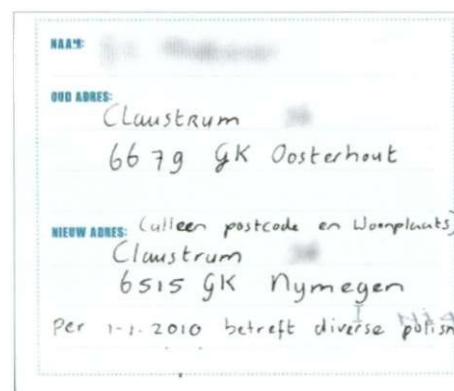
Afzenderdeel kaart 3 "Thuis in Gemeente Nijmegen"