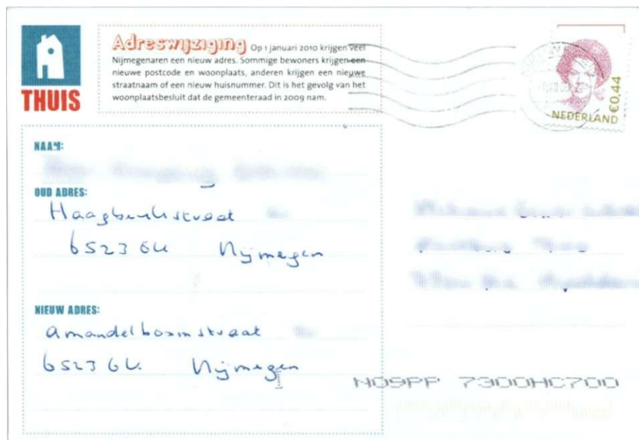
Achterzijde kaart 1 "Oost, west, thuis best"

de kaarten identiek, met als belangrijkste kenmerken het beeldmerk "Thuis" in de rechterbovenhoek, met daarnaast de volgende tekst: "ADRESWIJZIGING Op 1 januari 2010 krijgen veel Nijmegenaren een nieuw adres. Sommige bewoners krijgen een nieuwe postcode en woonplaats, anderen krijgen een nieuwe straatnaam of een nieuw huisnummer. Dit is het gevolg van het woonplaatsbesluit dat de gemeenteraad in 2009 nam."