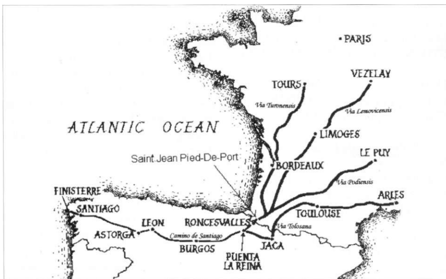
Kaartje met de pelgrimsroutes naar Santiago de Compostella. Toine Lamers vertelt over één van de routes die hij heeft afgelegd in Frankrijk.

Gestileerde Jacobsschelp, zoals die kan worden aangetroffen op locaties langs de route, waar pelgrims onderweg op een gastvrij onthaal kunnen rekenen.