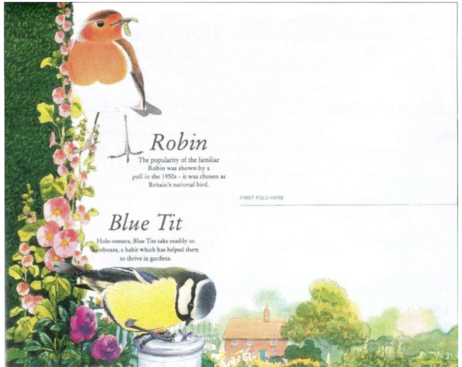
1: 'Britse tuinvogels': roodborstje en pimpelmees (fragment).

Het roodborstje ( Erithacus rubecula ) is een graag geziene vogel. Dat geldt ook in Groot-Brittannië, waar het beestje bij een enquête in de jaren '50 de populairste vogelsoort bleek. Sindsdien vervult de 'Robin', zoals hij daar genoemd wordt, de rol van nationaal symbool. Op het luchtpostblad 'Britse tuinvogels' (1994) staat het roodborstje afgebeeld samen met drie andere bekende soorten: de huismus, de merel en de pimpelmees (afb. 1).