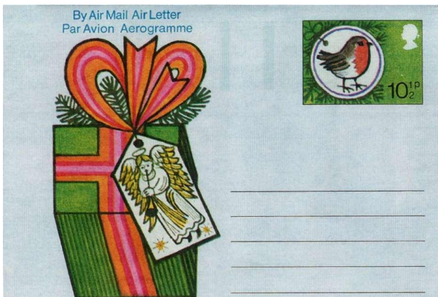
2: Voorzijde luchtpostblad kerstversiering (1977).

De afbeeldingen op het luchtpostblad 'Kerstmis' uit 1992 zijn ontleend aan oude papieren kerstdecoraties, in 'poezieplaatjes'-stijl. Eén van die plaatjes toont een roodborstje met in zijn bek een takje met bessen (afb. 3).