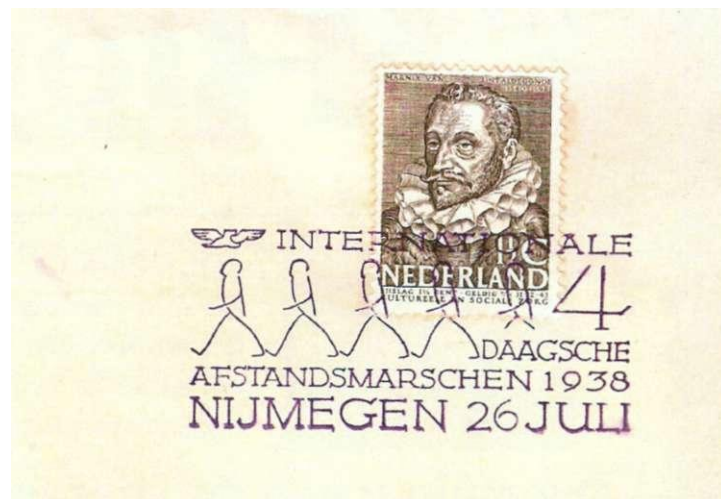
Afb. 2 Stempel van 26 juli 1938, in violet.

daagse. 2) In deze eerste aflevering worden de stempels uit 1938 en 1939 besproken. In het zomernummer van NovioPost (vóór de Vierdaagse van 2009) zal er een 2e aflevering volgen. Ook in latere jaren zal dit onderwerp regelmatig terugkeren, want het aantal filatelistische aspecten is nogal groot: postzegels, gelegenheids- en vlagstempels, enveloppen, frankeremachinstempels, Maggi- en andere reclamekaarten, enzovoort.