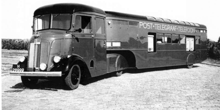
Afb. 3 Het Autopostkantoor uit 1939, met tractor (trekker) en oplegger (aanhangwagen).

Uit 1939 is er een grotere variatie in stempels. Enerzijds door de komst van het Autopostkantoor naar Nijmegen. Maar ook omdat er meerdere kleuren inkt gebruikt werden bij de afstempelingen.