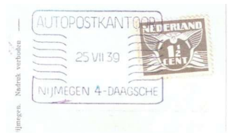
Afb. 10 Verzoekstempel van Gelegenheidsstempel Autopostkantoor, in de afwijkende kleur blauw, op blanco kaart met datum 25 juli 1939.