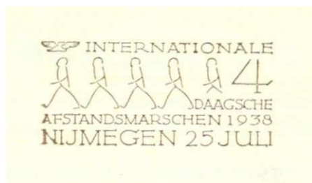
Afb. 1 Ontwerp van het gelegenheidsstempel Internationale 4 Daagse Afstandsmarsen 1938, Nijmegen 25 juli.

Maar 100 jaar Vierdaagse marsen leek ons toch een uitstekende aanleiding om dit jaar een paar keer extra aandacht te besteden aan de filatelistische aspecten van de Vier-