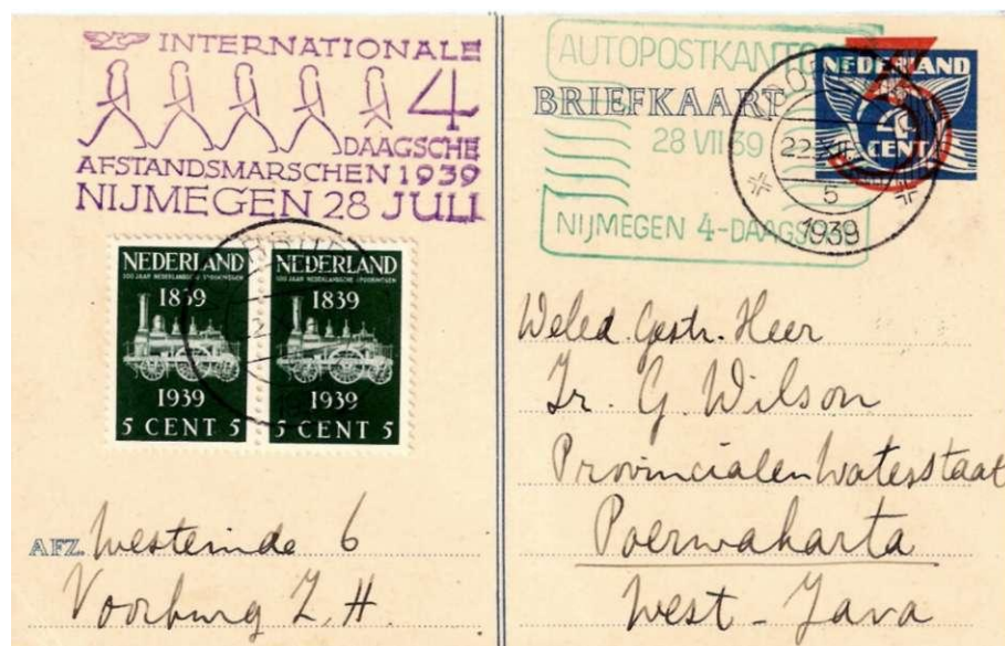
Afb. 15 Filatelistisch maakwerk: briefkaart met 2 stempels, op 22 december met nieuwe frankering verstuurd naar West-Java.

5) Na Nijmegen is het Rijdend Postkantoor alleen nog in gebruik geweest in Rotterdam (Generaal Appèl Feijenoord Stadion), en in Olst-Olanto. Het is in de oorlog door de bezetter in beslag genomen en weggevoerd. In juni 1952 werd autopostkantoor 2 - waarvan de oplegger geheel werd nagebouwd van het ontwerp in eind jaren '30 - voor het eerst ingezet, opnieuw in Assen. Het deed dienst tot eind 1969, en is toe