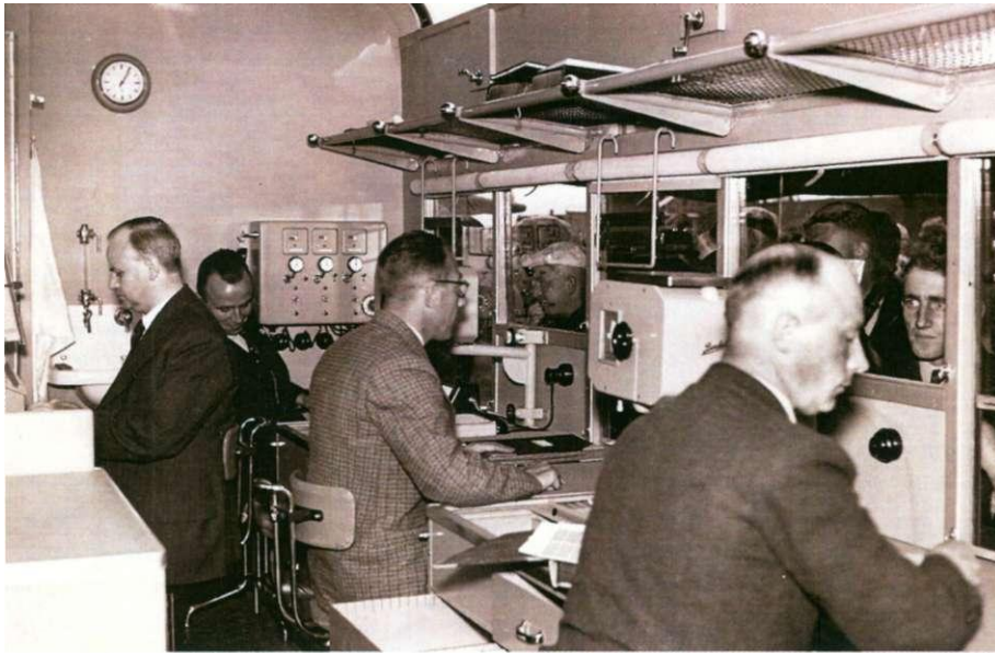
Afb. 4 Interieur met loketten in het Autopostkantoor, 1 juli 1939 in Assen.