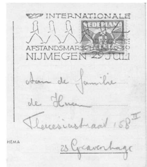
Afb. 14 Gelegenheidsstempel (brievenbus) in afwijkende kleur zwart, met datum 29 juli 1939.