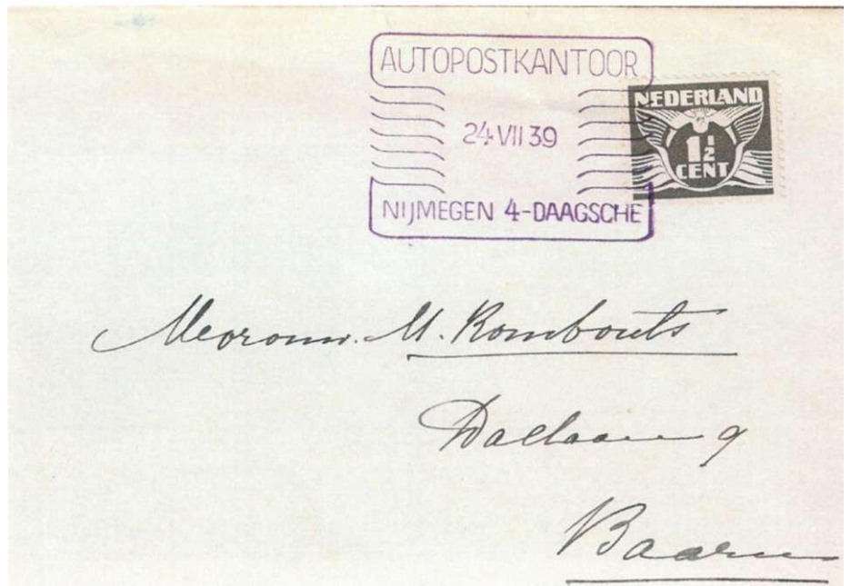
Afb. 8 Stempel Autopostkantoor van maandag 24 juli 1939, de eerste dag, op brief in violet.