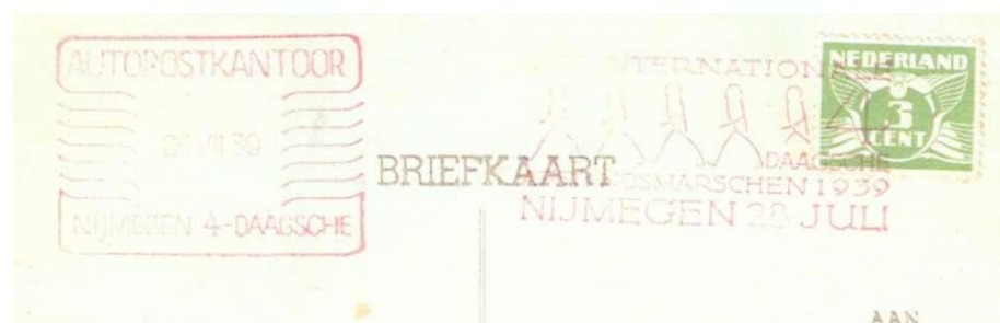
Afb. 13 Twee rode stempels, vermoedelijk op verzoek: links autopostkantoor (26 juli), en rechts het brievenbusstempel van 28 juli.