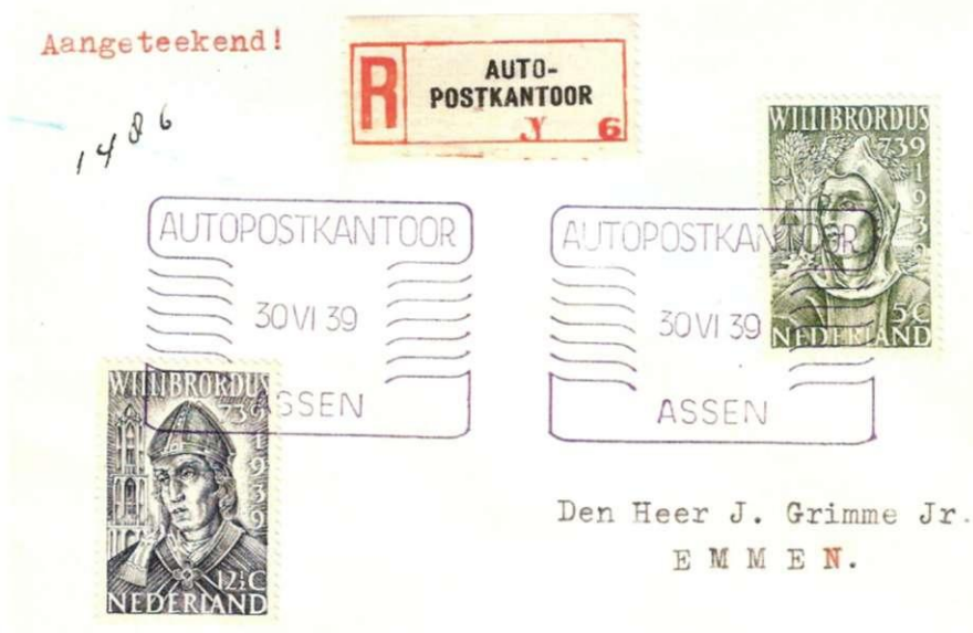
Afb. 5 Aangetekende brief, op 30 juni verzonden vanuit Autopostkantoor Assen.

Het eerste Nederlandse Rijdend P.T.T. kantoor is op 1 juli 1939 in gebruik genomen bij de TT-races in Assen (Afb. 3, 4 en 5). Het was bedoeld om ingezet te worden op plaatsen, waar in verband met wedstrijden, tentoonstellingen, meetings e.d. veel mensen werden verwacht die behoefte hadden aan diensten van de P.T.T. 4) Het autopostkantoor bestond uit twee delen: een "tractor" en een oplegger. Als het kantoor open was, stond de aanhangwagen los van de trekker. De motor daarvan draaide wel, want die leverde via een dynamo de benodigde energie voor het kantoor. Vanwege het lawaai van de motor stond de trekker op 30 m. afstand van de aanhangwagen, die 8 uitgeklapte schrijftafels had, een drietal loketten, en drie geluiddichte telefooncellen. Vrijwel alle postale handelingen konden worden verricht.