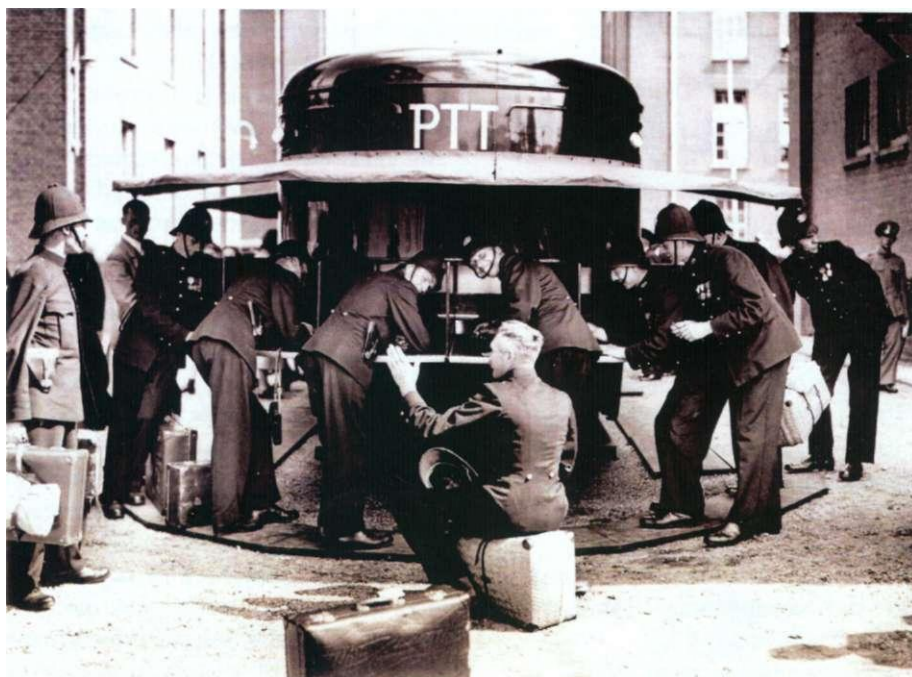
Afb. 6 Het autopostkantoor op het Molenveld in Nijmegen, tijdens de Vierdaagseweek van 1939. Politieagenten (Engelse Bobbys) met koffers schrijven en verzenden hun correspondentie.