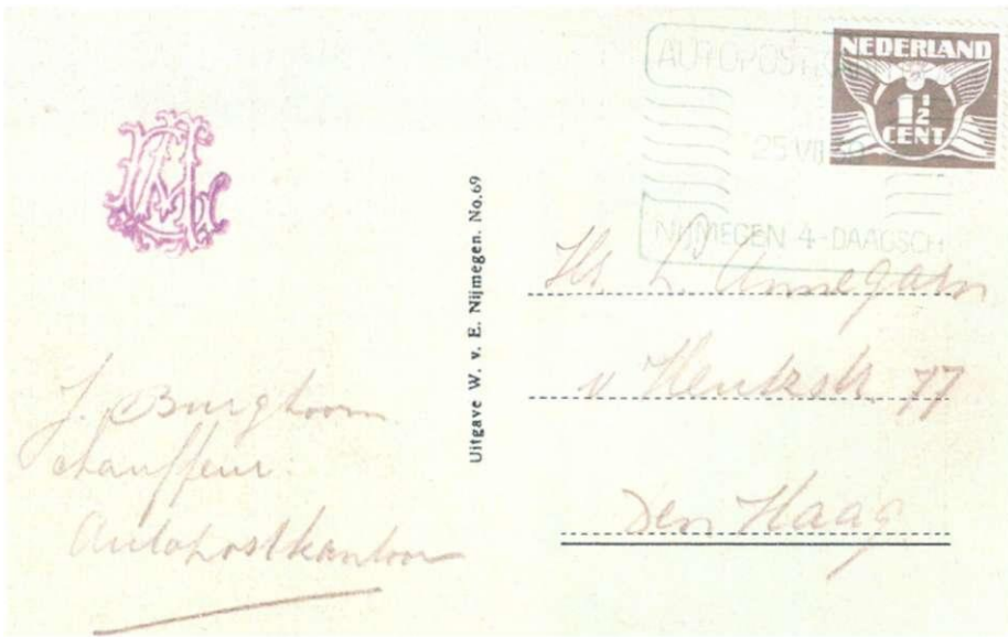
Afb. 9 Afdruk van de eerste wandeldag, dinsdag 25 juli, in groen. Afzender: J. Burghoorn, chauffeur Autopostkantoor !