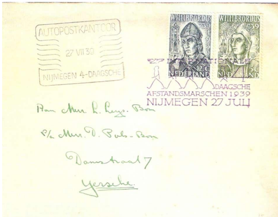
Afb. 12 Afdruk van het violette gelegheidsstempel, naast een afdruk van het Autopostkantoor in zwart, beide van 27 juli 1939.