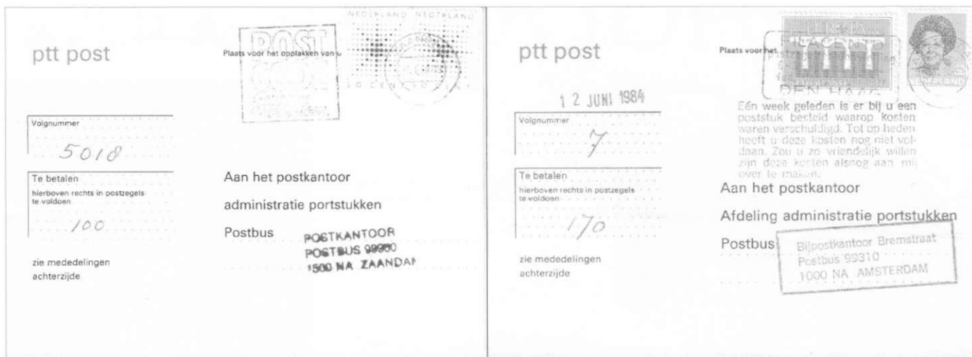
Afb.3 (links): Oude portbeffingskaart. De postzegels voor f. 1,00 zijn geplakt en de kaart is verzonden. Kennelijk zijn ook gebruikte kaarten in handen van verzamelaars gekomen.