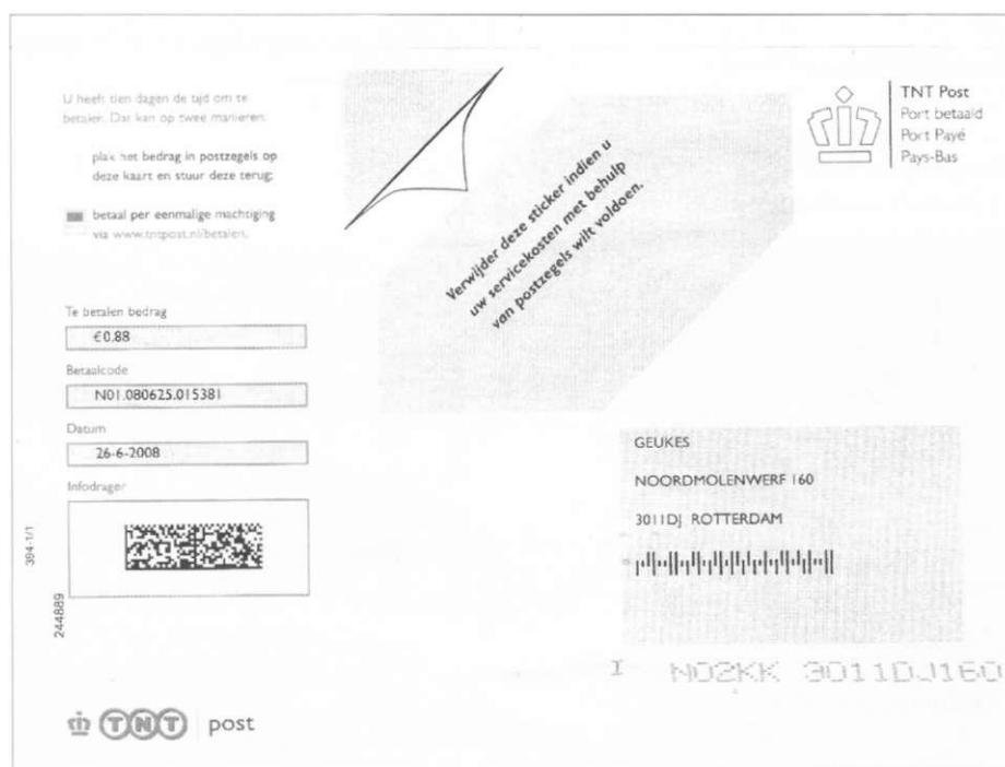
Afb.4: Het strafport kan nog steeds op de "oude manier" betaald worden, namelijk door het plakken van het bedrag in postzegels en de kaart (na verwijdering van de adressticker) terug te zenden aan TNT Post, Afdeling Servicekosten in Alphen aan de Rijn. Maar het kan ook anders: namelijk per eenmalige machtiging via www.tntpost.nl betalen. Op die site staat uitleg over de gang van zaken. De betaalcode bestaat uit a) 3 karakters voor intern gebruik bij TNT (N01), b) de datum van verwerking: 080625 (25 juni 2008) en c) een volgnummer (015381). Deze portkaart behoort bij de ansichtkaart van Afb. 1. De verwerking in de PIM heeft dus 10 dagen vertraging opgeleverd!

1) Mechanisatieknipsels, uitgave van de Groep Postmechanisatie, Po & Po. Hierin staan ook de "voorloperstickers" afgebeeld.