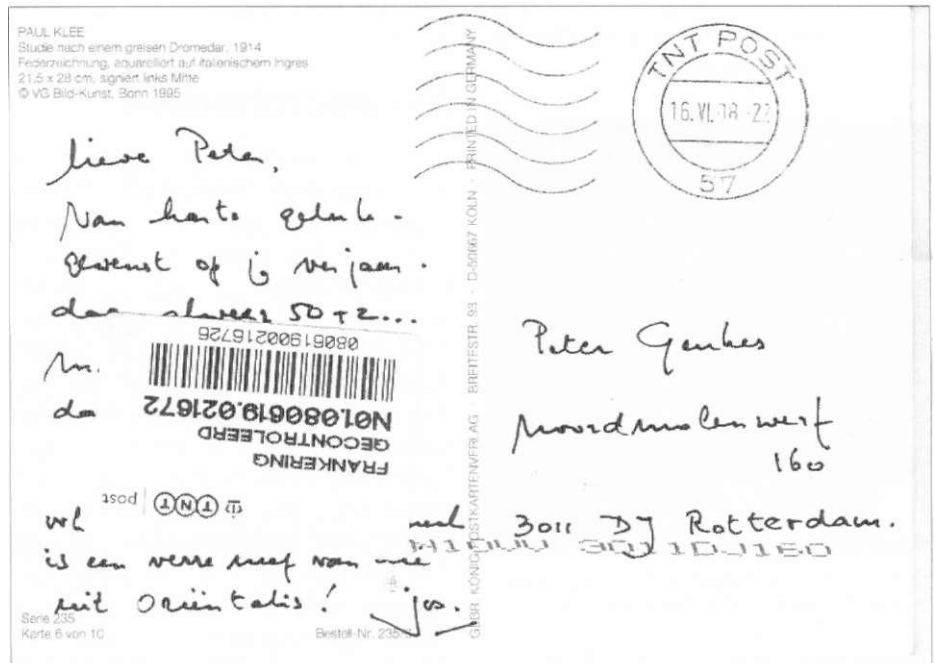
Afb.1: Kaart, verzonden op 16 juni 2008, voorzien van een sticker "Frankering gecontroleerd" met een nummer en barcode. De stickers zitten vrijwel altijd kopstaand op de post, soms ook over het adres!

Nadat de "portzegels" waren afgeschaft, werd "strafport" geïnd door middel van strafportkaarten, die aan het poststuk werden gehecht (Afb. 3). Op die kaartjes kon dan alsnog (in postzegels) het verschuldigde bedrag worden voldaan.