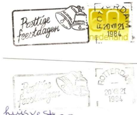
Afb. 83: Twee plaatsnaamstempels in Fliermachines in Rotterdam, met opvallend verschillende "lay out" van de naam Rotterdam.

Ook zijn er voorbeelden van verschillende uitvoeringen van de stok. Het meest bekend is Rotterdam met de plaatsnaam "hoog" en "laag" (Afb.83). Ook hier is het van belang dat bekende data uitwijzen dat er geen sprake is van een "nieuwe" stok, als vervanging van een versleten of beschadigde plaatsnaamstempel (zie later Afb. 86 en 87).