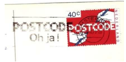
Afb. 85. Ook beschadiging of een vermindering in de vlag kan erop wijzen dat er meerdere machines tegelijk in gebruik zijn, zoals hier een rafelige bovenlijn.

B. Tot nu toe hebben we ons bezig gehouden met verschillen, om het aantal machines vast te kunnen stellen. Maar stempels kunnen ook vervangen worden. Als er in een plaats met één machine tijdens de jaren van gebruik een beschadiging optrad, werd het stempel vervangen. Soms zijn er dan óók "detailverschillen" in de stempels aan te wijzen. Maar die komen dan dus niet voor op eenzelfde datum en tijd (Afb. 86 en 87).