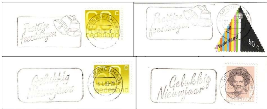
Afb. 91. Moderne stempels Prettige Feestdagen en Gelukkig Nieuwjaar, in twee verschillende handschriften.

D. Ter afsluiting van dit eerste deel van "oog voor detail" aandacht voor een stempel met een spiegelbeeldige letter N (zie afb. 92 voorpagina). Deze fout moet gemaakt zijn bij de vervaardiging van het