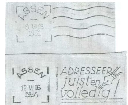
Afb. 86. Plaatsnaamstempel Assen, in 1950 in gebruik gekomen, werd medio 1951 al vervangen door een stempel met kleinere letters. Hier afstemmingen uit 1951 en 1957.

B. Tot nu toe hebben we ons bezig gehouden met verschillen, om het aantal machines vast te kunnen stellen. Maar stempels kunnen ook vervangen worden. Als er in een plaats met één machine tijdens de jaren van gebruik een beschadiging optrad, werd het stempel vervangen. Soms zijn er dan óók "detailverschillen" in de stempels aan te wijzen. Maar die komen dan dus niet voor op eenzelfde datum en tijd (Afb. 86 en 87).