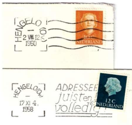
Afb. 87. Ook in Hengelo (Ov.) werd de in 1950 met de machine meegeleverde stok al snel vervangen. Getoond wordt een afdruk van november 1958.

De eerste daarvan is de vlag "Luchtpostblad" (Afb. 89).