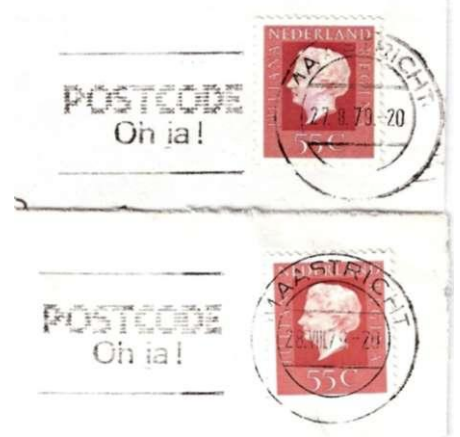
Afb. 88. Klussendorfstempel Maastricht, op 27 augustus 1979 nog met het vervangende stempel Type XVII (Arabische 8), op 28 augustus werd het stempel met Romeinse maandkarakters weer in gebruik genomen.

2c. Is een variant van 2b: terwijl bij de voorgaande typen de top van de t van 'luchtpostblad' als het ware in de rechtertip van de staart uitmondt, blijft hij er bij dit type duidelijk beneden."