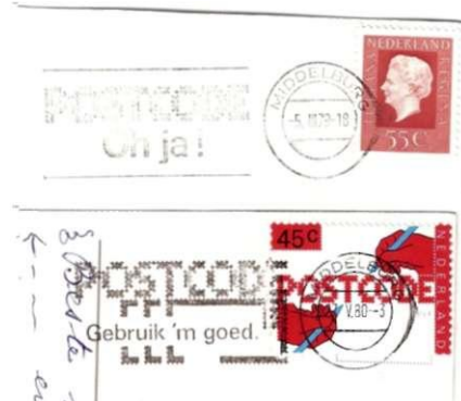
Afb. 84. Twee afdrukken van Universalmachines in Middelburg. De stok bij de "Postcode Oh ja!" vlag is onbeschadigd, die bij "Postcode gebruik 'm/goed'" vertoont een beschadiging, links boven in de buitenencirkel. Op zich genomen is dit geen aanwijzing voor het bestaan van 2 machines omdat een beschadiging of slijtageverschijnsel natuurlijk op een gegeven moment kan ontstaan. Maar van Middelburg is bekend dat de beschadiging tegelijkertijd voorkomt naast een onbeschadigde stok. Voor deze afbeelding is echter gekozen voor duidelijke plaatjes, maar wel op een ander tijdstip.

Slijtage of een beschadiging van een stempel zegt op zichzelf dus niets over het aantal machines. Alleen dan als ze tegelijkertijd voorkomt met gave afstemmingen, mag die conclusie wel getrokken worden.