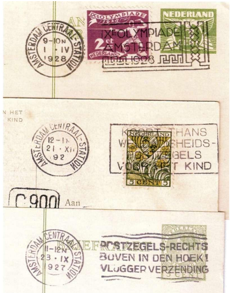
92 Drie afdrucken met stempel Amsterdam Centraalstation in de periode eind september 1927 - 2 april 1928, met spiegelbeeldige N in StatioN, data resp. 23 september 1927, 21 december 1927, en 1 april 1928.