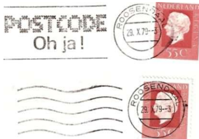
Afb. 82: stempeltype XVII (kleine ronde plaatsnaamstempel) Roosendaal, 2 afdrukken van 29.X. 79 --3, de een met postcodervlag, de ander met golflijnen. Omdat de plaatsnaamstempels ("stok") volledig identiek zijn, is het gebruik van twee verschillende stempels op hetzelfde moment een aanwijzing voor aanwezigheid van twee machines.

A. Soms kan het van belang zijn om te weten hoeveel machines er in een bepaald kantoor of centrum tegelijkertijd in gebruik zijn (of zijn geweest). Vooral als het gaat om meerdere machines van hetzelfde type, zijn we aangewezen op het vinden van onderlinge verschillen. Een gemakkelijk aanknopingspunt is het gebruik van verschillende vlaggen. Maar dan moet wel aangetoond kunnen worden dat die vlaggen tegelijk in gebruik waren. Met andere woorden: het datumstempel moet dezelfde dag, maand en uurkarakters dragen (Afb. 82).