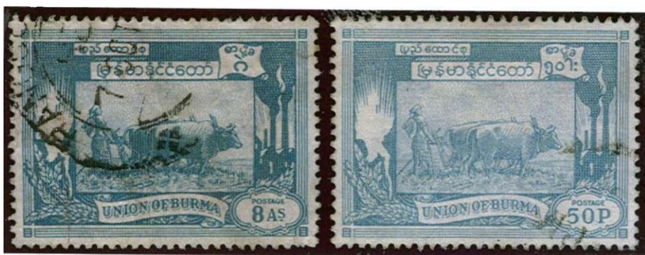
links frankerzegel in de oude Indiase munteenheid, rechts in de nieuwe munteenheid