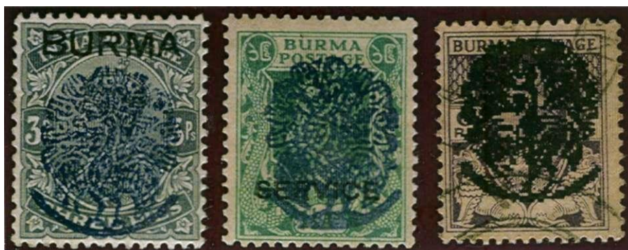
"Peacock" opdrukken van het Burmese Independence Army. De rechter opdruk is duidelijk vals. De linkse is waarschijnlijk echt en de opdruk op de groene zegel waarschijnlijk vals.