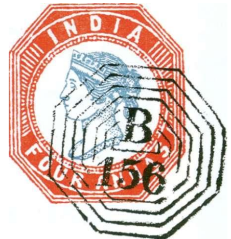
Typisch stempel uit Bengalen (B) met nummer 156 van Rangoon

Met Kerstmis 1941 bombardeerden de Japanners de hoofdstad Rangoon en begin 1942 werd Birma door de Japanners bezet. Samen met de Japanners trok het Burmese Independence Army op tegen de Engelsen. Zij dachten daardoor onafhankelijk te worden. Ze overdrukten de zegels met het beeld van een pauw, het symbool van Birma. Bekend zijn opdrukken uit Myaungmya, Pyapon en Henzada, waar vele vervalsingen van bekend zijn.