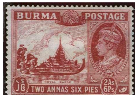
Eerste eigen uitgifte van Birma