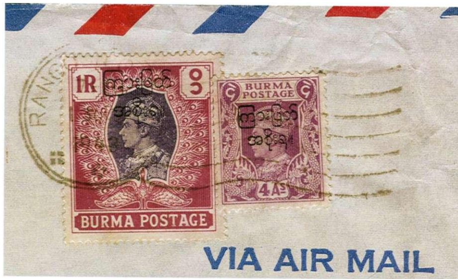
Fragment met zegels uit de interim periode en opdruk in Birmees "Interim-Regering"