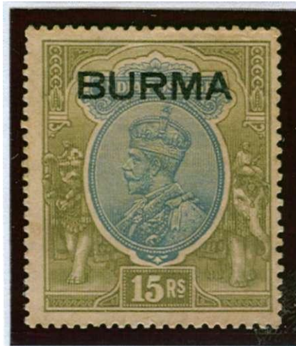
Zegel India met opdruk Burma

Het gebied kreeg geen eigen status maar behoorde tot India. Er werden dus Indiase zegels en postwaardestukken gebruikt. Het hoorde postaal bij Bengalen. Pas op 1 april 1937 werden India en Birma van elkaar gescheiden. Dat betekende dan ook de eerste zegels, zegels van India met opdruk BURMA. Pas in november 1938 verschenen de eerste eigen zegels.