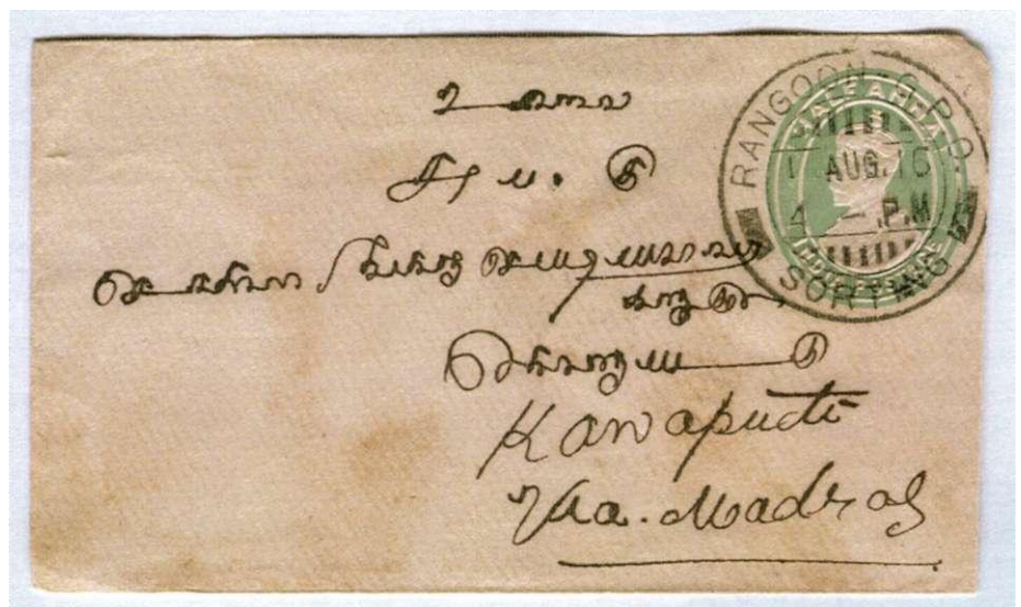
Postwaardestuk van India gebruikt in Birma (stempel RANGOON-G.P.O. SORTING). Verstuurd naar Konapet in India via Madras.