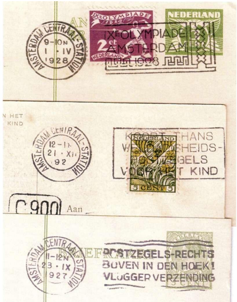
92 Drie afdrukken met stempel Amsterdam Centraalstation in de periode eind september 1927 - 2 april 1928, met spiegelbeeldige N in StatioN, data resp. 23 september 1927, 21 december 1927, en 1 april 1928.