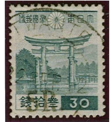
Japanse zegel voorzien van opdruk voor gebruik in Birma

Gedurende de bezetting werden in eerste instantie Japanse zegels overgedrukt met nieuwe waarden. Daarna werden eigen zegels uitgegeven voor Birma, o.a. de Farmer-uitgifte. Hoewel het een goedkope frankierserie is, bestaan er reprints en vervalsingen van.