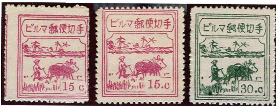
De zogeheten Farmer uitgifte. De perforatie werd niet al te netjes uitgevoerd zoals met name aan de linker zegel te zien is