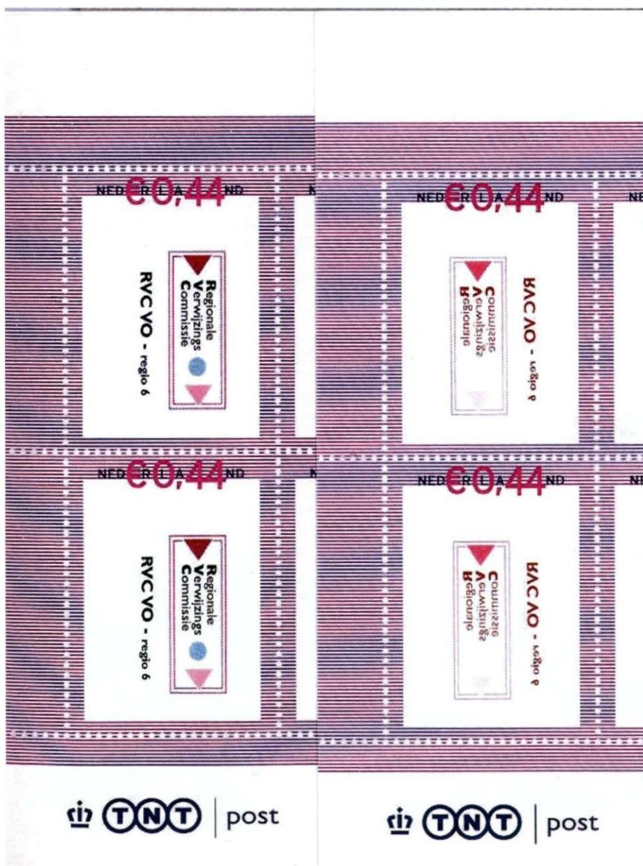
Afbeelding 3: Spiegelen, kantelen en warmere kleuren.