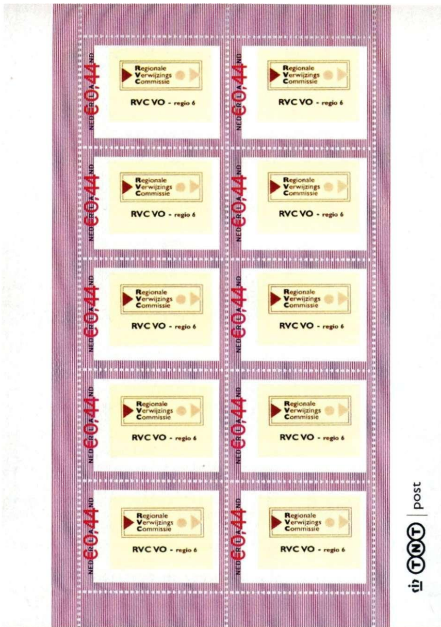
Afbeelding 4: Zo ziet de RVC-VO er in 'spijl' uit: afbeelding wordt dus niet exact in het midden geprint en verloopt ook nog enkele millimeters.