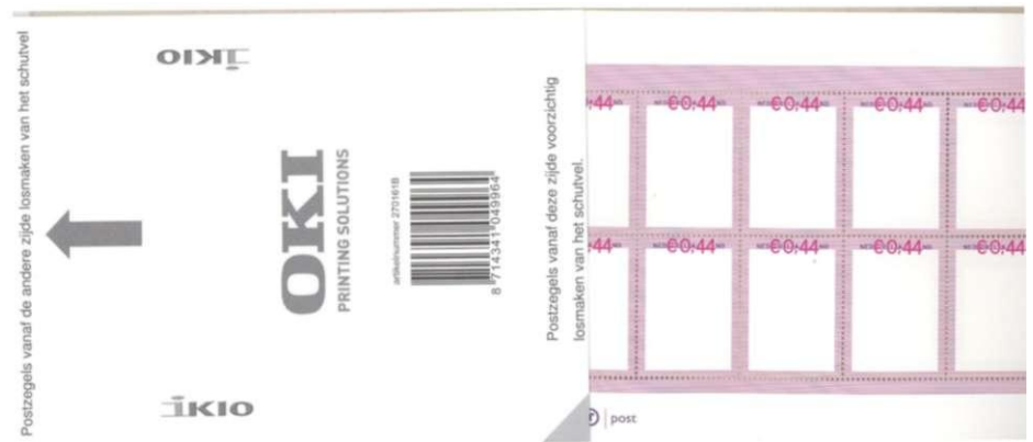
Afbeelding 6: Velletje aan verkeerde zijde op schutblad geplakt (zegels onbedrukt, afbeeldingen op schutblad)

Ton Buitenhuis, Nijmegen, 29 november 2007