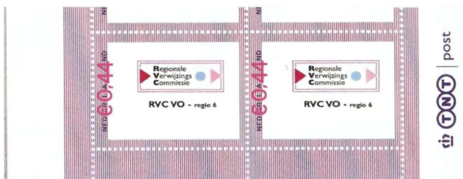
Afbeelding 1: zegel met de waarde aanduiding links.

Hoe komt zo'n eigen postzegel tot stand? Hier volgt het relaas van de voorbereiding en de productie van de zegel voor de RVC-VO Regio 6.