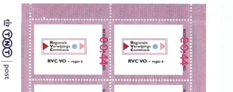
Afbeelding 2: zegel met de waarde aanduiding rechts.