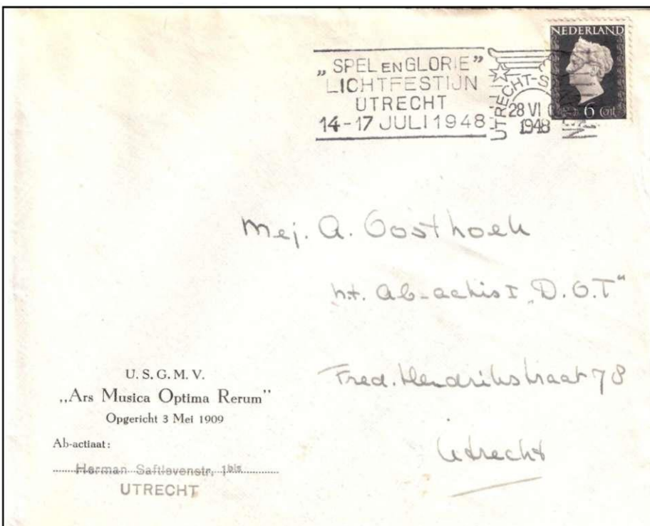
Afz. 80: vlagstempel "Spel en Glorie" uit Utrecht (-Station), dat in juli 1948 werd gebruikt om de aandacht te vestigen op het Lichtfestijn in Utrecht.