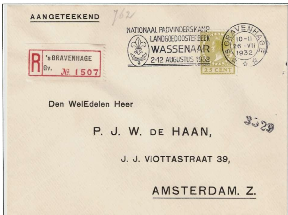
Afb. 77: aangeteekende brief met het vlagstempel Nationaal Padvinderskamp Oosterbeek in Wassenaar, gestempeld te is Gravenhage op 26 juli 1932. Vlagstempel links van het datumrondje.

Er is een opstel bewaard gebleven door een van de deelnemers, afkomstig uit Hilversum. Hij of zij schrijft o.a.: