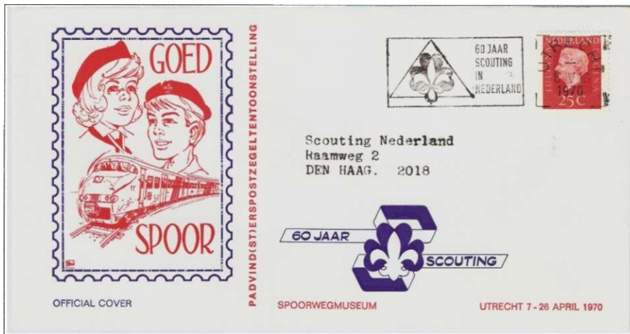
Afz. 79: "officiële enveloppe" van de postzegeltonstelling Goed Spoor in het Spoorwegmuseum in Utrecht, van 7 - 26 april 1970. De enveloppe was al van tevoren gestempeld, namelijk op 6 april 1970.

"We werden verdeeld in fietsers en "treiners" (er liepen extra treinen!). In Utrecht angekommen, gingen we met de bus, Zagen nog een gedeelte van de optocht. Dan het Stadion, dat opgepropt was (met padvindsters en padvindsters).