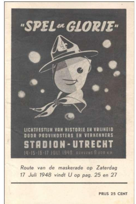
afz. 81: voorzijde van het Programmaboekje van het lichtfestijn van historie en vrijheid door padvindsters en verkenners in 1948 te Utrecht.