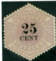
De laatste telegramzegel met een waarde van 25 cent, die op 12 mei 1903 werd uitgegeven.

Door de invoering van een minimumtarief van 25 cent voor het binnenlands verkeer werd op 12 mei 1903 een zegel met een waarde van 25 cent in gebruik genomen.