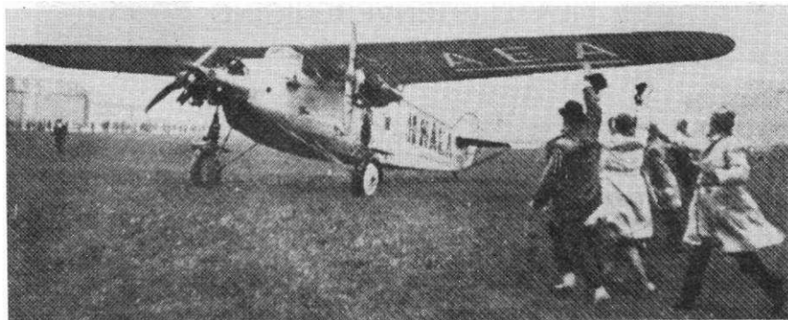
De landing van de "Postduif" op Schiphol.