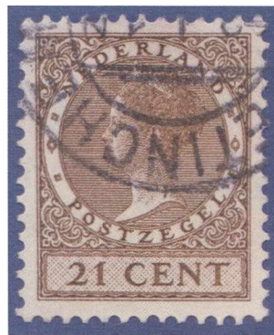
Afbeelding 5: Postzegel 21 cent olijfbroen (NVPH nr. 189).

van een aangetekende brief binnenland. Het port van 7½ cent en het aantekenrecht 15 cent konden samen door het plakken van één postzegel voldaan worden.