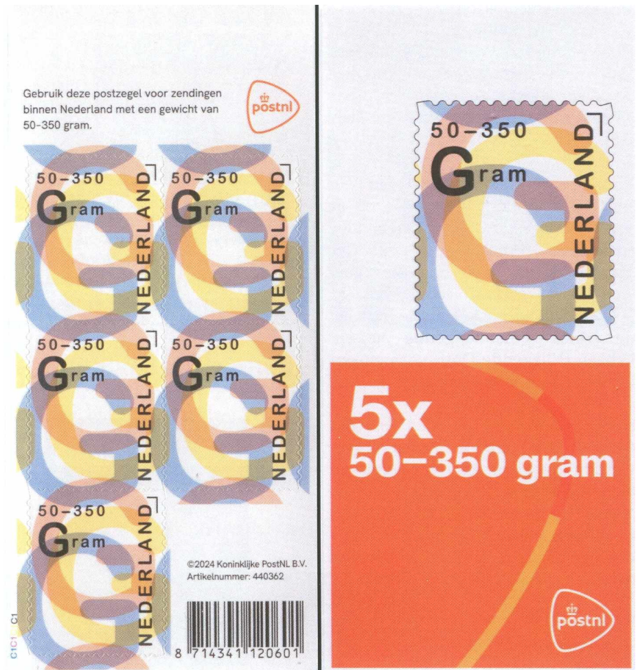
Afbeelding 1: Voor- en achterzijde van het nieuwe velletje.

In 2024 zijn de gewichtsklassen 50-100 en 100-350 gram samengevoegd tot 50-350 gram met een tarief van € 3,70. Als je op een brief van die gewichtsklasse drie zegels met de waarde '1' plakt, kom je 43 eurocent tekort. Als je er 4 van die zegels op plakt, doe je PostNL 66 eurocent cadeau, en dat is zeker niet de bedoeling. Een speciale zegel in het juiste tarief was dus zeer welkom voor postgebruikers die vaak zware brieven versturen.