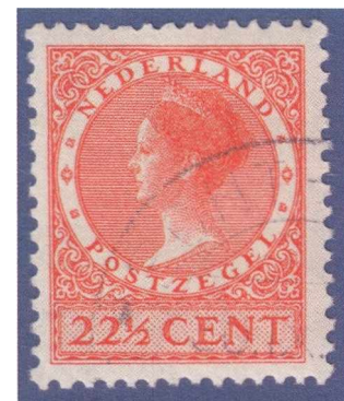
Afbeelding 8: Postzegel 22½ cent oranje (NVPH nr. 191).