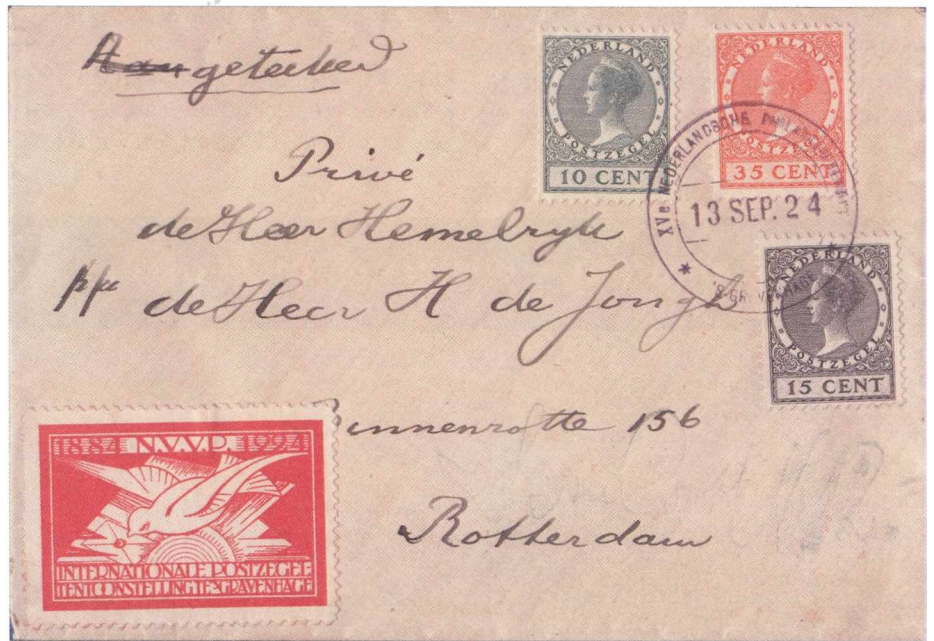
Afbeelding 1: De drie tentoonstellingszegels op een enveloppe met het tentoonstellingsstempel (dat alleen op 13 en 14 september 1924 werd gebruikt) en een vignet. Vermoedelijk is het enveloppe nooit verstuurd: geen aantekenstrookje en geen aankomststempel.

Een mooi voorbeeld is de zegel 22½ cent olijfbroen die in 1927 werd uitgegeven, NVPH nr. 190 (afb. 3). Deze zegel was bedoeld voor de frankering