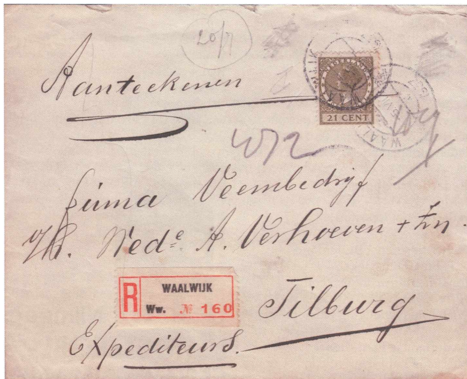
Afbeelding 7: Aangetekende brief, op 5 juli 1937 verstuurd van Waalwijk naar Tilburg. Tarief 21 cent voldaan met NVPH nr. 189.