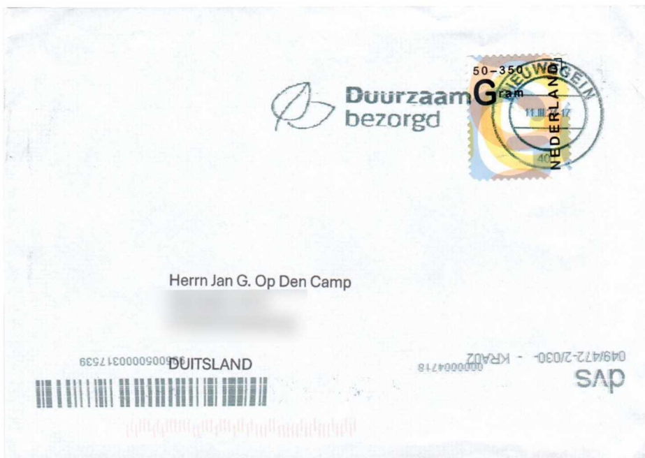
Afbeelding 4: De nieuwe zegel op een zware brief naar Duitsland, verstuurd op 11 maart 2024.

wordt om ze in de machinale verwerking te herkennen. Bij iedere zegelwaarde hoort een apart frankeerhaakje, met pootjes van verschillende lengte. We kenden al frankeerhaakjes voor onder meer de zegelwaarden '1', '2', 'Internationaal' en 'December'; daar komt nu het frankeerhaakje voor de waarde 'G' bij.