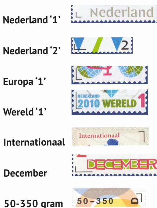
Afbeelding 5: Voorbeelden van frankeerhaakjes.